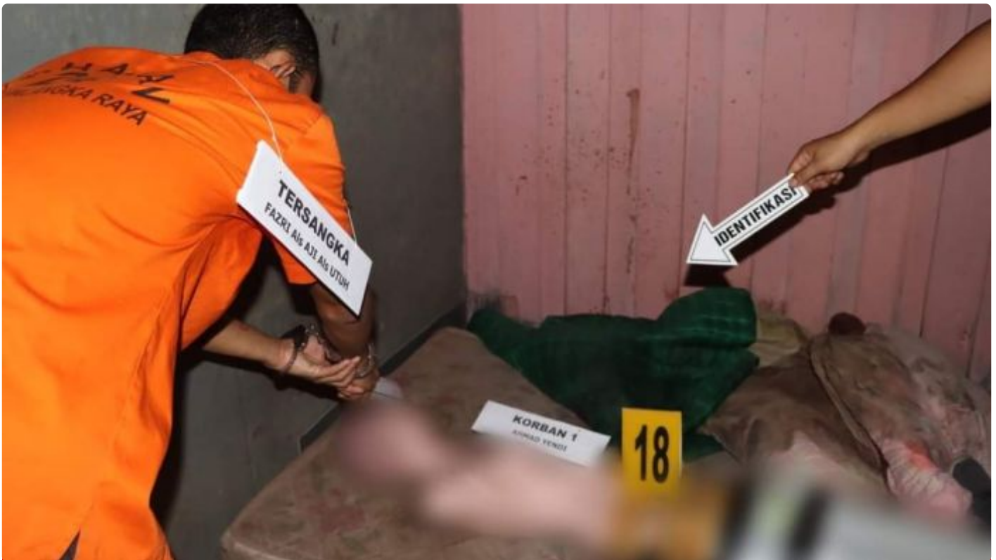
Tersangka F (26) Saat Melaksanakan Rekontruksi

PALANGKA RAYA - Proses penyidikan masih terus dilakukan oleh Satuan Reserse Kriminal (Satreskrim) Polresta Palangka Raya, Polda Kalteng terhadap kasus pembunuhan pasangan suami istri (pasutri) yang terjadi di wilayah hukumnya.